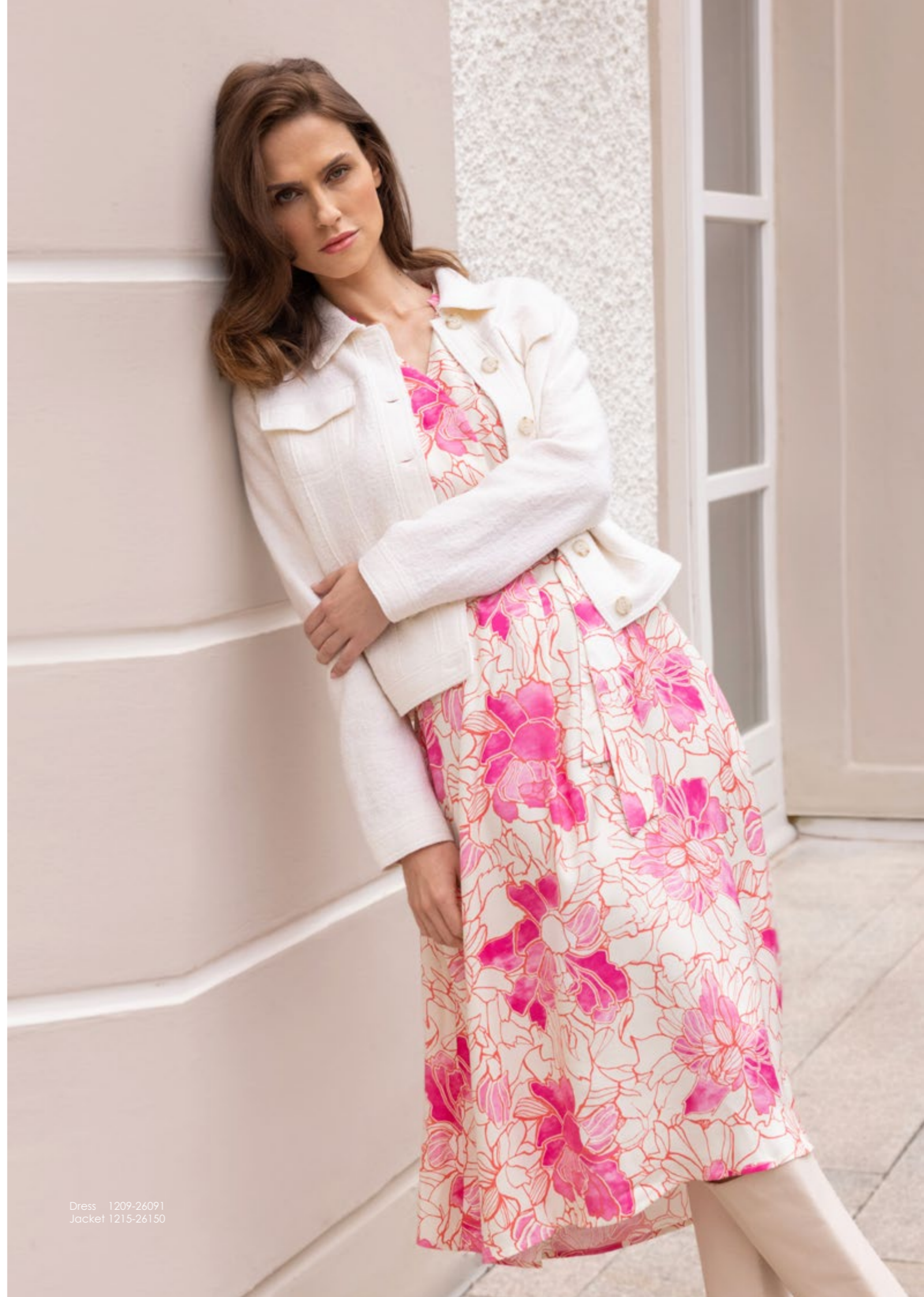
Dress 1209-26091 Jacket 1215-26150