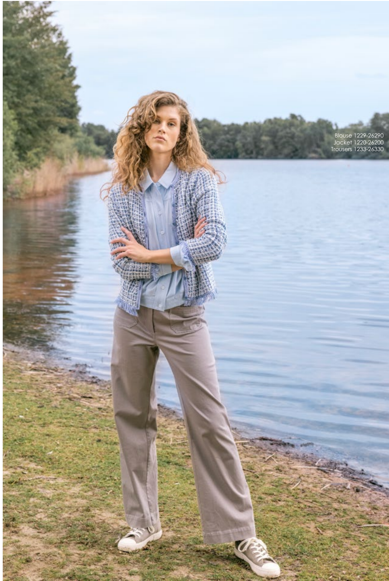
Blouse 1229-26290 Jacket 1220-26200 Trousers 1233-26330