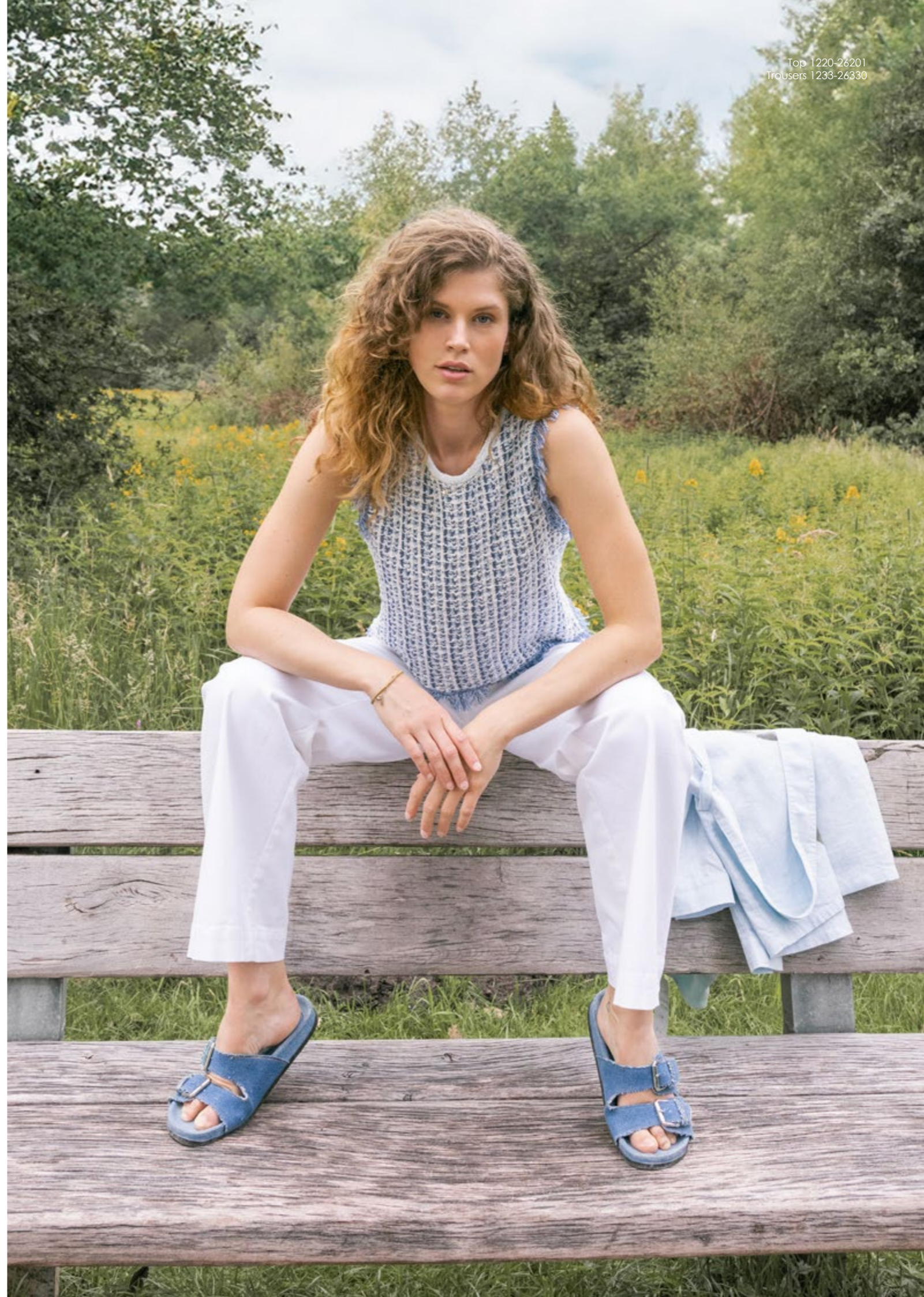
Top 1220-26201 Trousers 1233-26330