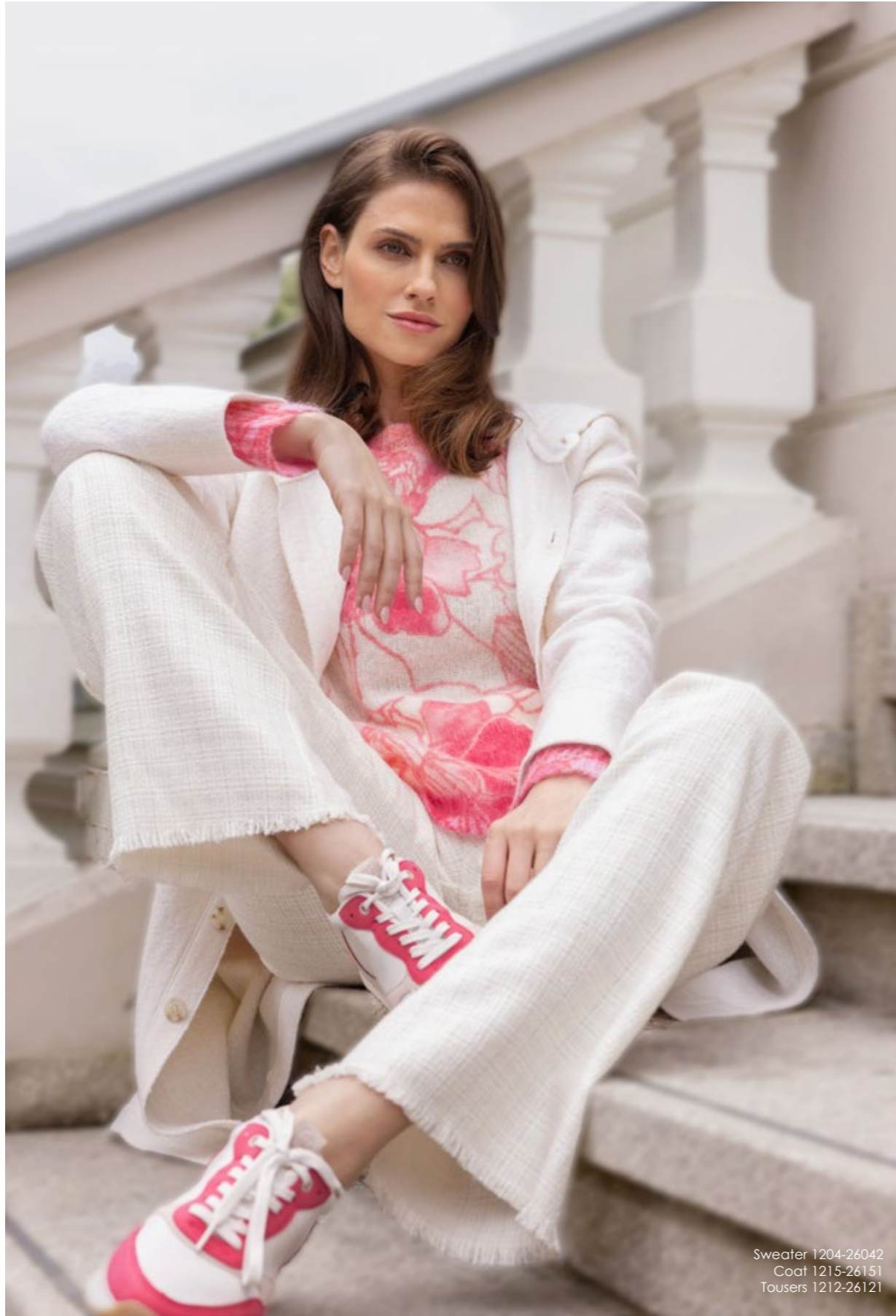
Sweater 1204-26042 Coat 1215-26151 Tousers 1212-26121