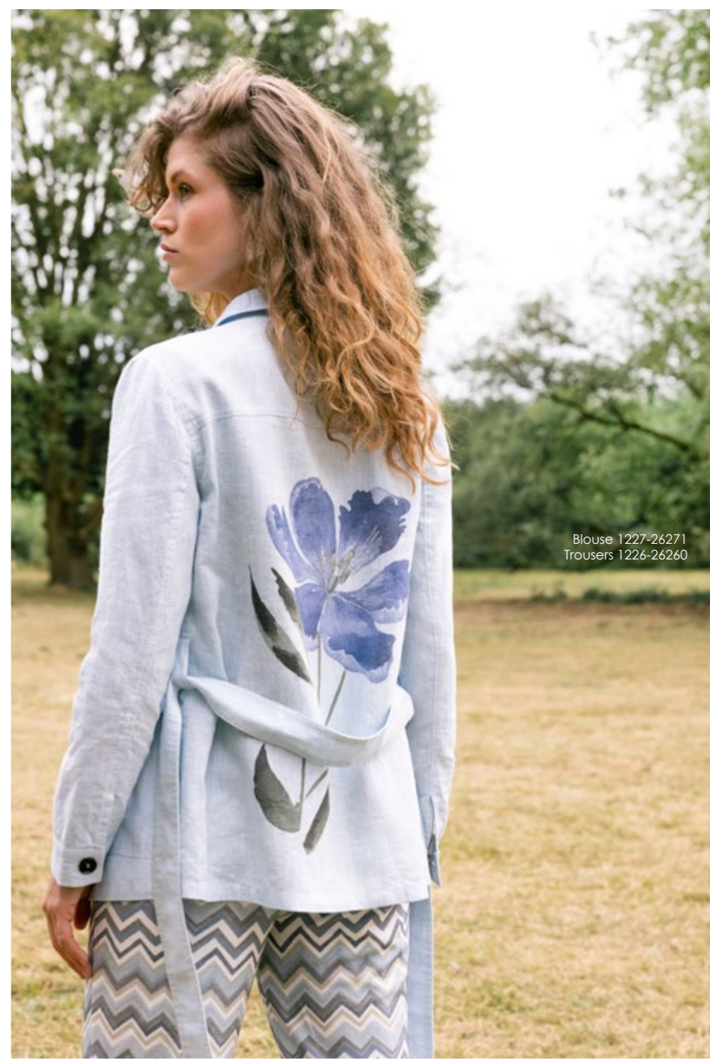
Blouse 1227-26271 Trousers 1226-26260