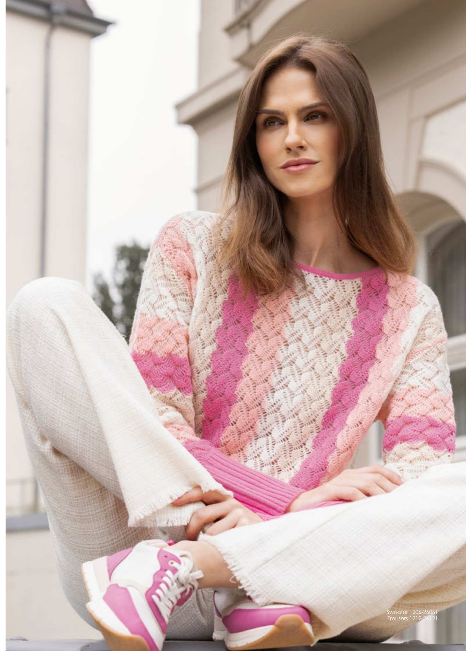
Sweater 1206-26061 Trousers 1212-26121