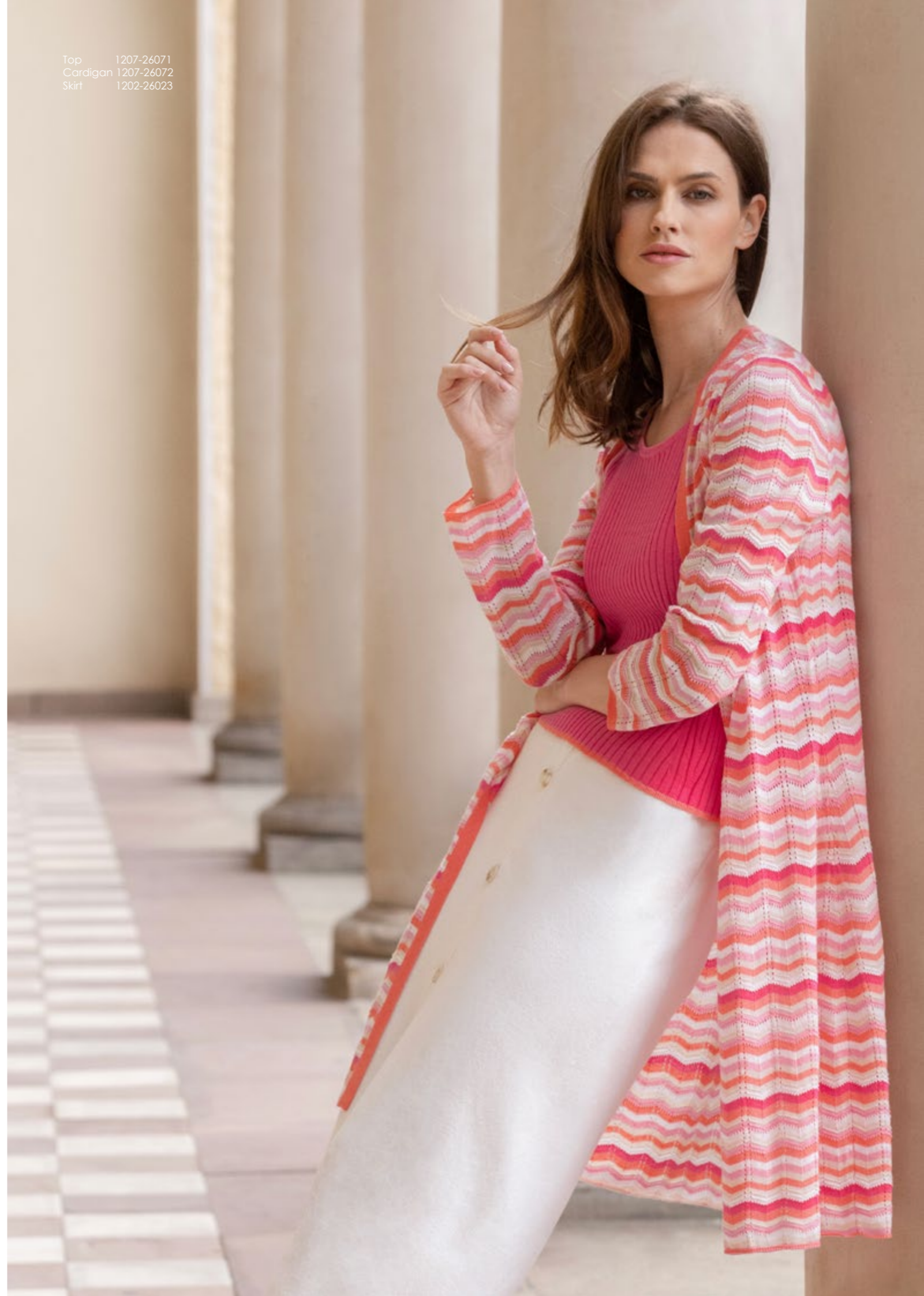
Top 1207-26071 Cardigan 1207-26072 Skirt 1202-26023