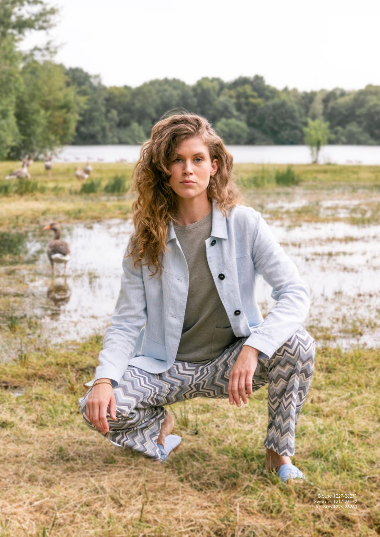
Blouse 1227-26271 Sweater 1217-26172 Trousers 1226-26260